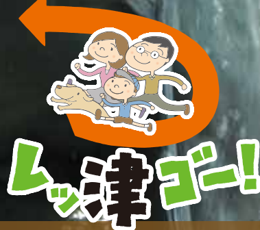
津城本丸跡内 藤堂高虎