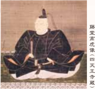
藤堂高虎像(四天王寺蔵)